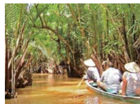
メコン川クルーズイメージ