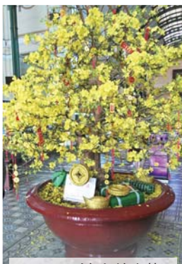
正月にだけ咲く花