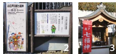
1. 成田山川越別院 2. 妙善寺の七福神看板 3. 天然寺の寿老人