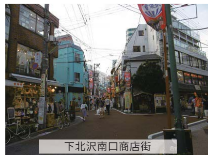
下北沢南口商店街

言わずと知れた若者の街。ファッションや飲食関係の店舗はもちろん、小劇場やライブハウスも多く点在し、たえまなく多くの人で溢れていました。その他にも、アンティークな商品を扱うお店があったり、路地裏にひっそりとたたずむ穴場のような飲食店があったりと、まさに「オシャレな街」といったところです。