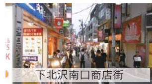
下北沢南口商店街