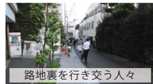
路地裏を歩き交う人々