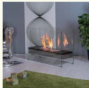
※バイオエタノール暖炉 特大 セレブレーション Carlo Milano

高級感のあるバイオエタノール暖炉は、世界中のハイクラスホテルやレストランで使われています。燃えても煤や煙が出ないため、マンションでも取り付けが可能です。