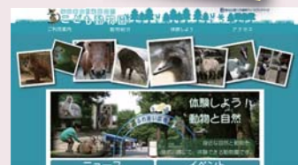
※参照：智光山公園こども動物園ホームページ http://www.parks.or.jp/chikozan/zoo/