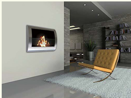
※出典：バイオエタノール暖炉 壁掛け Fireplace

冬場に「暖かな暖炉が欲しいな」なんて考えている方もいらっしゃるのではないのでしょうか。そこでご紹介したいのは、人気の“バイオエタノール暖炉”です。