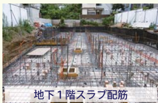
地下1階スラブ配筋