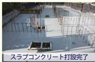
スラブコンクリート打設完了

無事に地階スラブコンクリートの打設まで完了いたしました。養生期間を設け、その後墨出しを行います。基礎工事は、建物を支えるとても重要な場所です。配筋、型枠、コンクリート打設など施工精度を高め慎重に工事を進めました。