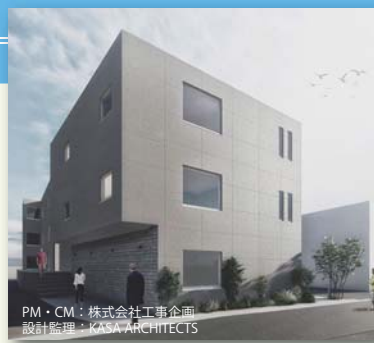
PM・CM：株式会社工事企画 設計監理：KASA ARCHITECTS

無事に地階スラブコンクリートの打設まで完了いたしました。養生期間を設け、その後墨出しを行います。基礎工事は、建物を支えるとても重要な場所です。配筋、型枠、コンクリート打設など施工精度を高め慎重に工事を進めました。